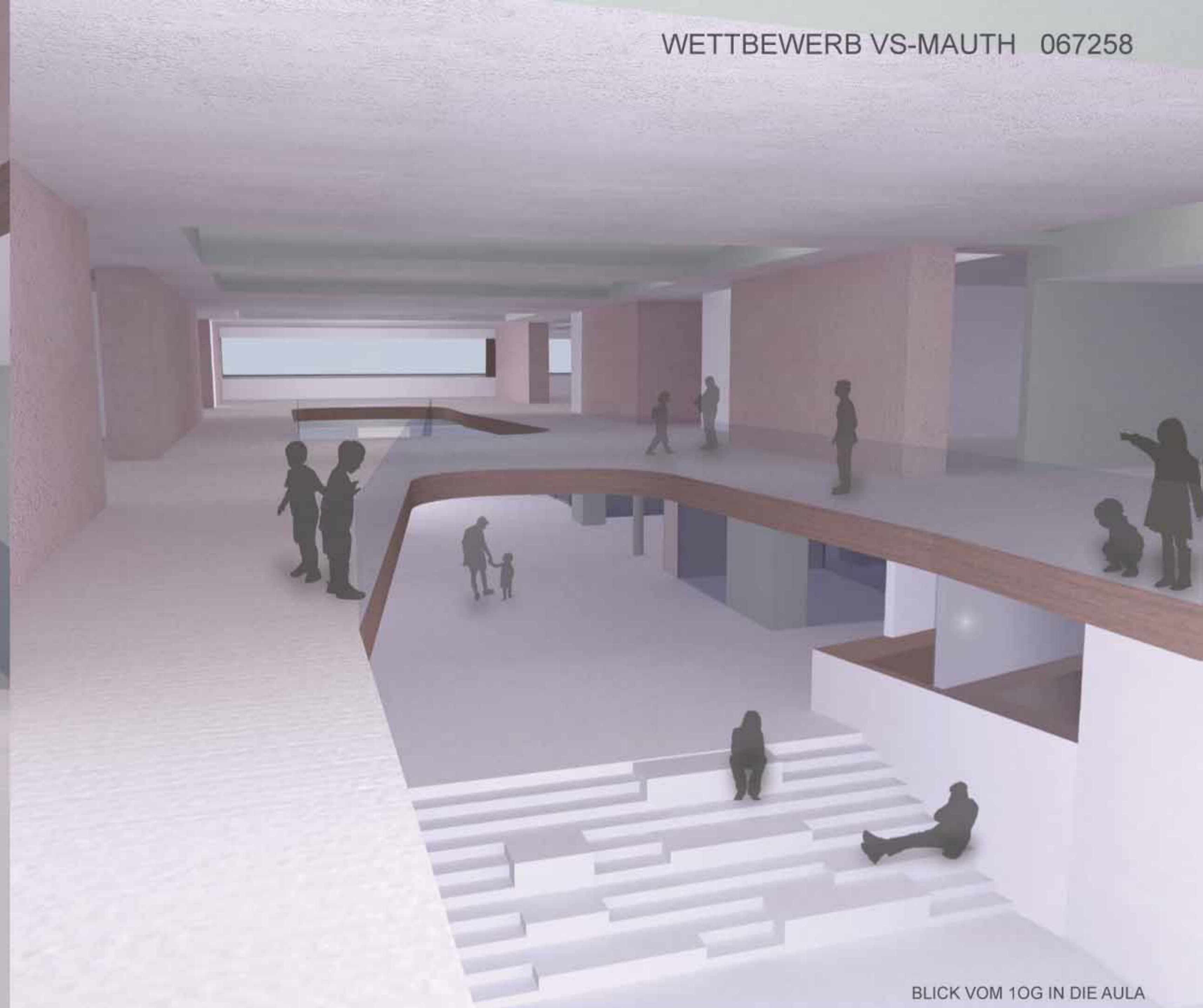
BLICK VOM 1OG IN DIE AULA