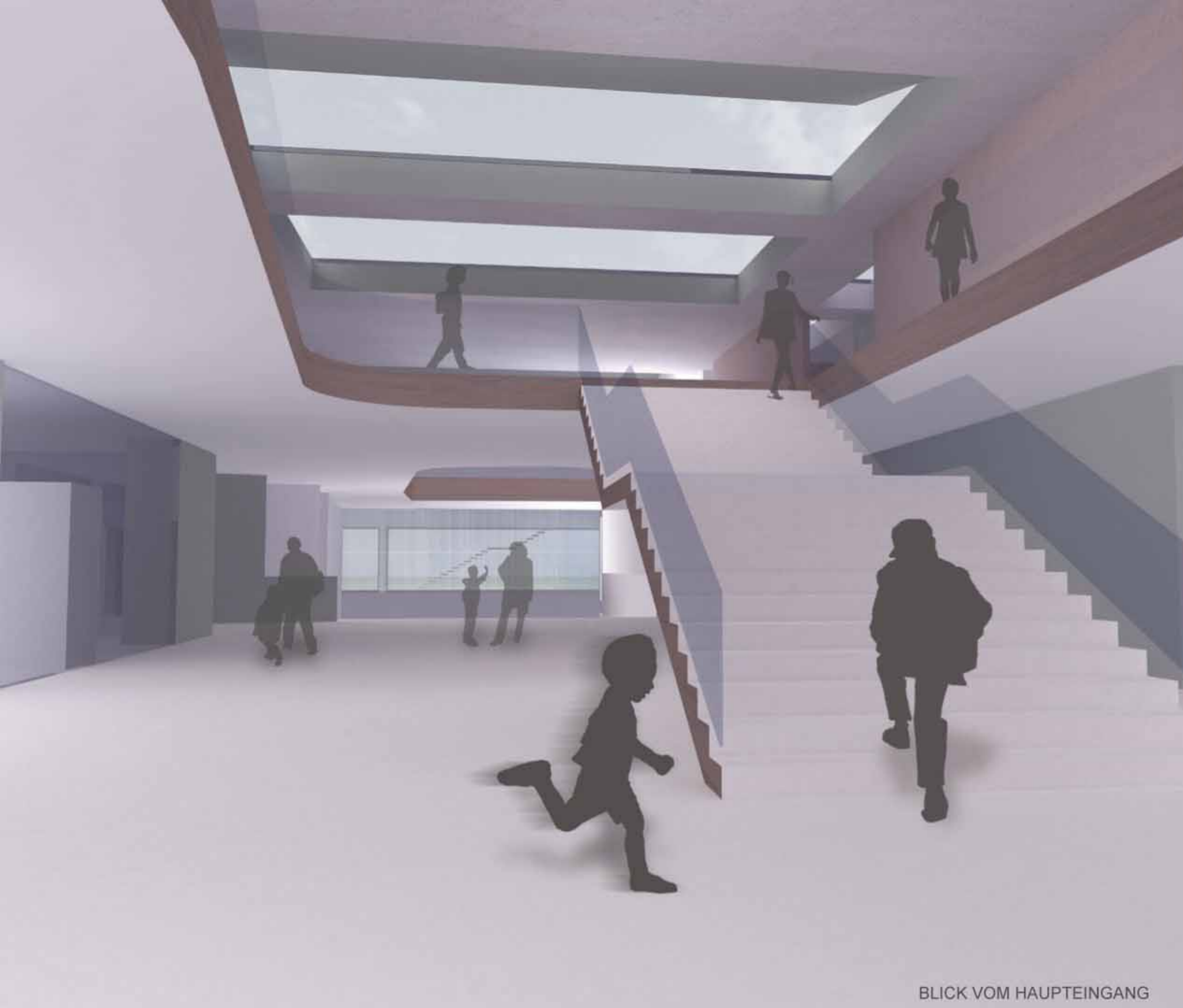
BLICK VOM HAUPTINGANG